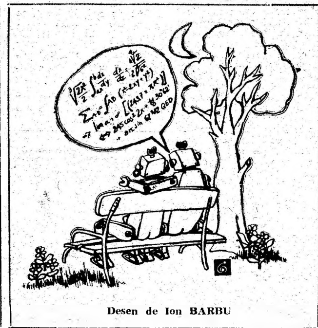
Desen de Ion BARBU

Teatrul de stat, în sala special amenajată, o seară culturală cu muzică și dans. Așadar, după preferințe, două discotece de valoare. (A.I.H.)