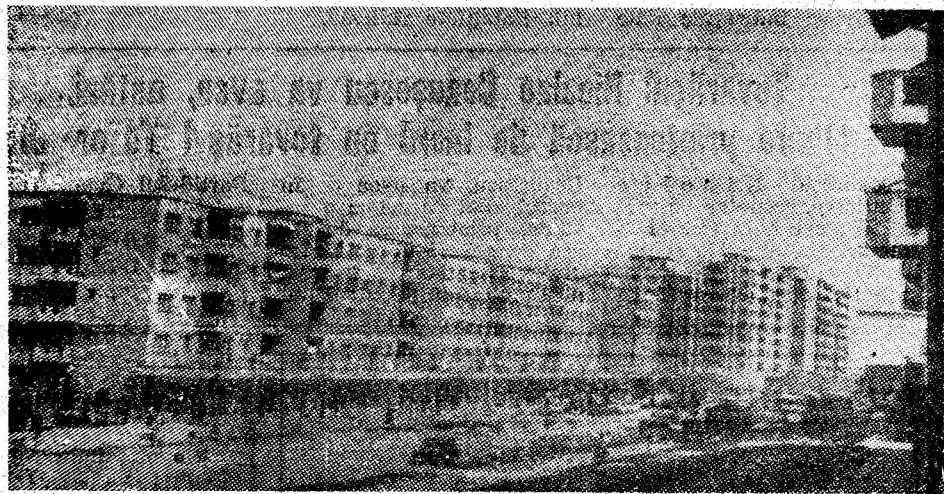
Vulcan, modernul bulevard.