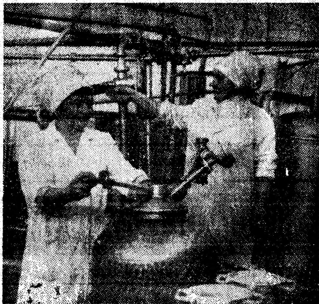
Aspect de muncă din secția pasteurizare a laptei din cadrul Fabricii de produse lactate Livezeni.