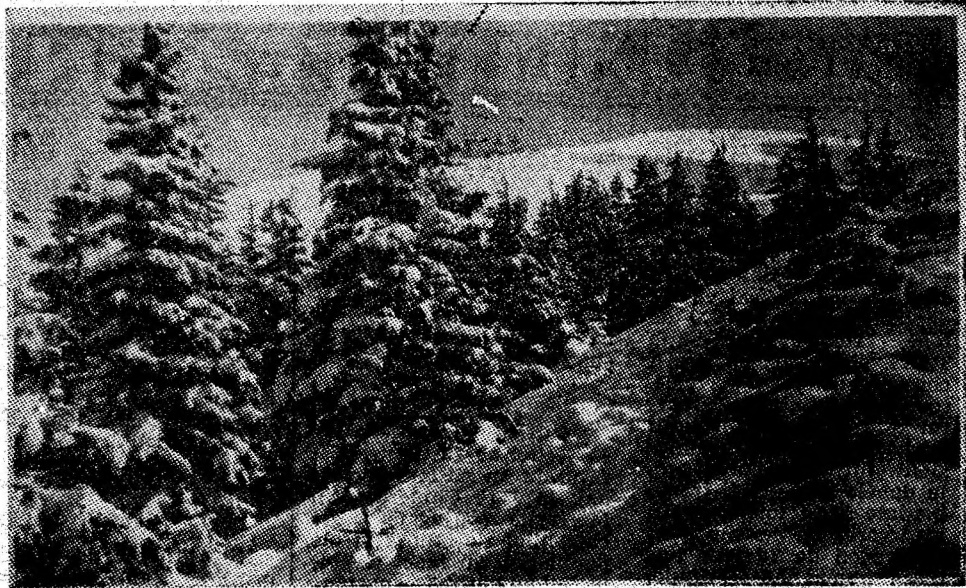
Imagine din Paring.