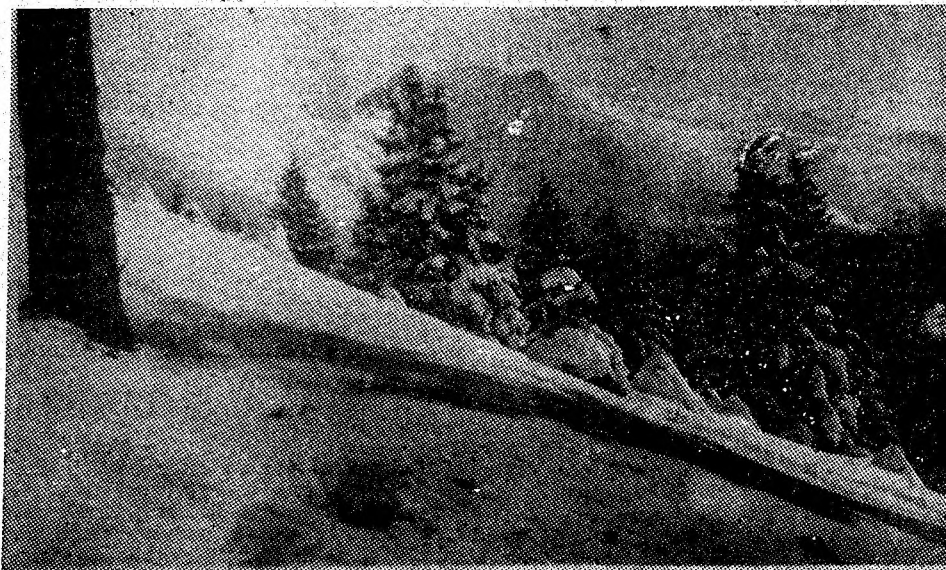
Paringul în straiete iernii.