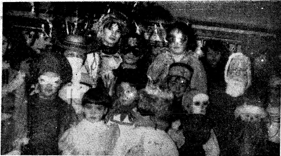
Devenit tradițional, „Carnavalul fulgilor de nea”, desfășurat vineri, 26 decembrie, a fost o acțiune reușită a Consiliului municipal al pionierilor. În imagine, un aspect de la parada celor mai reușite măști.