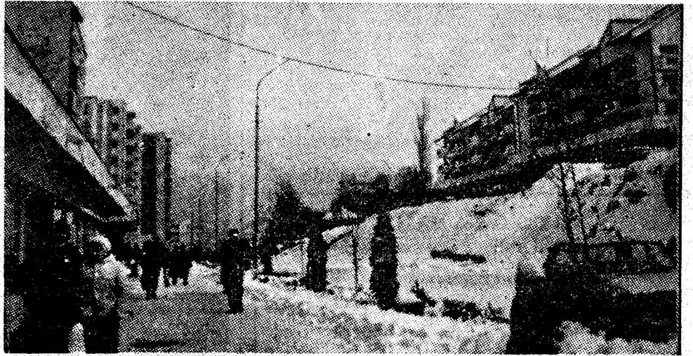
Secvență de iarnă pe artera principală a Vulcanului.

Pe aeroportul Otopeni, oaspetele a fost salutat de Petru Enache, vicepreședinte al Consiliului de Stat, Ioan Totu, ministrul afacerilor externe, de alte persoane oficiale.