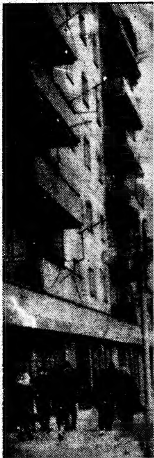
Verticale moderne din așezările minierești ale Văii Jiului.

Cursurile universității pentru anii I și III se desfășoară în ziua de luni, 12 ianuarie a.c., ora 16, la Casa de cultură.