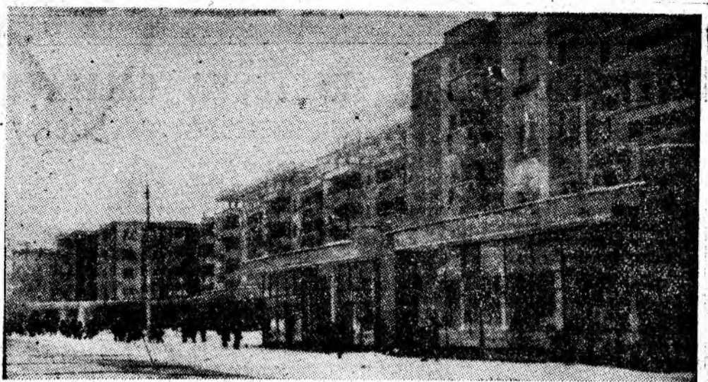
Orașul Petrila — la ora înnoirilor '87.