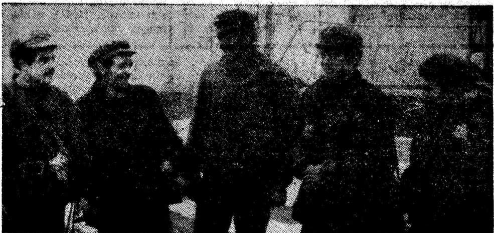
La I.M. Bărbănteni, rezultate bune obține și brigada lui Carol Martin, sectorul II. În imagine, șeful de brigadă, în mijloc, alături de cîțiva ortaci, la ieșirea din șut.