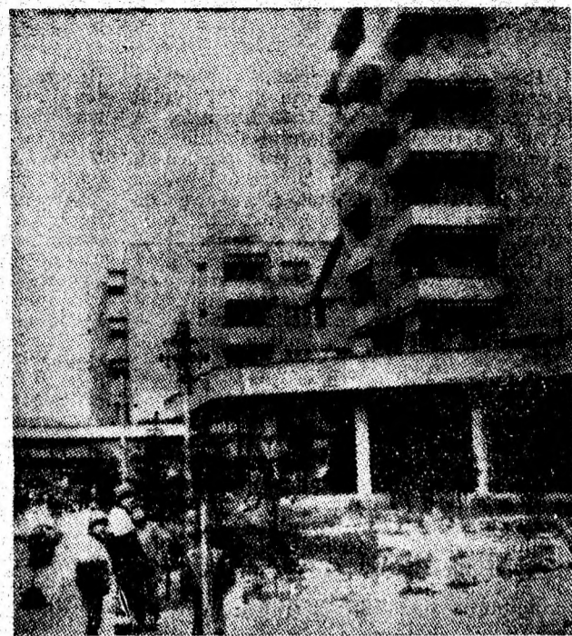
Decor de iarnă în orașul minerilor — Lupeni.

Insemnătatea deosebită a acțiunii care începe miercuri dimineață — 1 februarie, la ora 8 — impune cu necesitate exigență și responsabilitate în desfășurarea recensământului. Crescătorii de animale din orașele și comunele Văii Jiului au datoria cetățenească să acorde tot sprijinul în înregistrarea întregului efectiv animalier pentru fundamentarea științifică a unui ansamblu de măsuri destinate dezvoltării zootehnice.