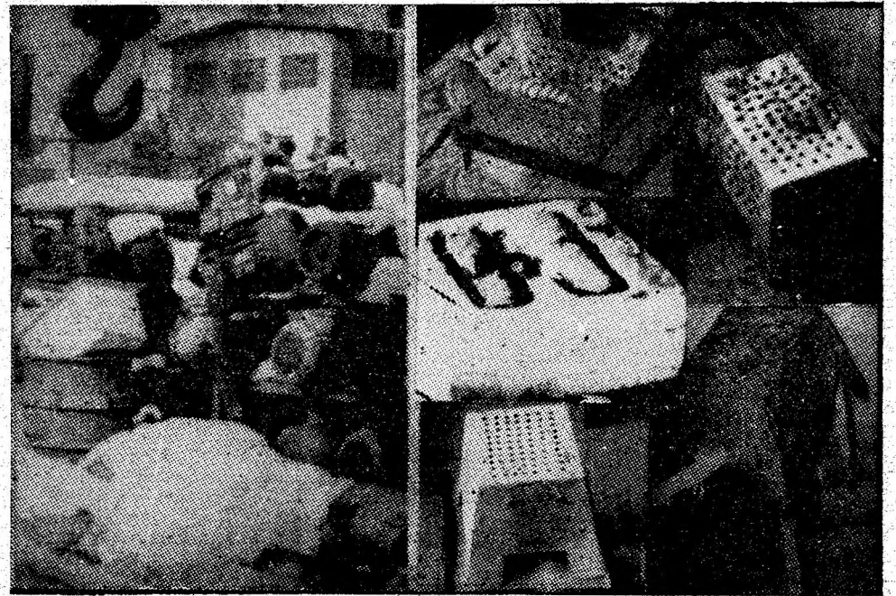
„Răspundere” și „inventivitate” în slujba risipei?!

Acestea sînt, pe scurt, constatările noastre. Cu toate aspectele sale neplăcute, raidul îl dorim nu numai critic, ci și constructiv, aspectele semnalate putînd și trebuind să deconclanșeze acțiuni de redresare a situației existente.