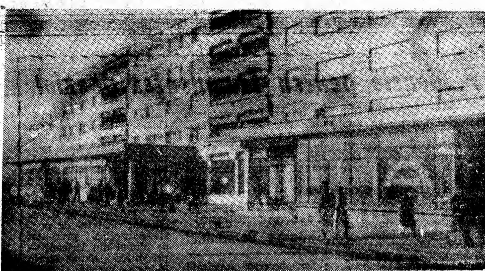
Zi de februarie, în noul centru civic al Lupeniului.

schimb, cit și membrii brigăzilor. Sterilul este depozitat de-a lungul fluxului de transport timp de trei zile. În fiecare a treia zi, la începutul schimbului al II-lea, transportul spre suprafață este destinat numai sterilului adu-