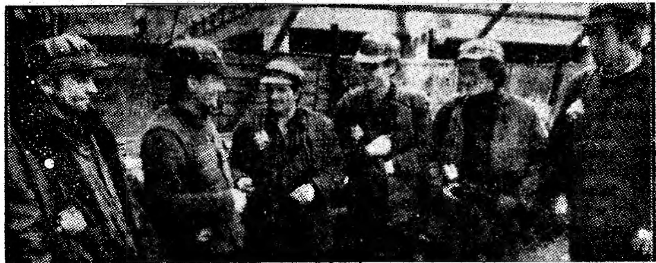
I.M. Lupeni. Înainte de intrarea în subteran, mineri de la sectorul II.