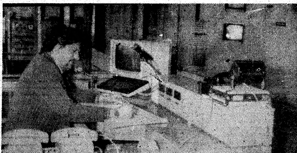
Moderna instalație de dispecerat a minei Livezeni.