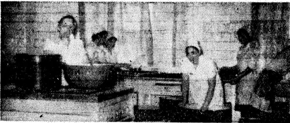
Aspect de muncă de la laboratorul de patiserie al ICSA-AP Petroșani