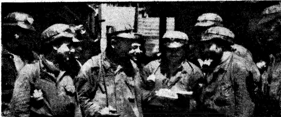
Sectorul II al minei Lupeni — colectiv care în anul 1986 a raportat îndeplinirea integrală a sarcinilor de plan, înainte de termen — a debutat și în acest an sub bune auspicii.