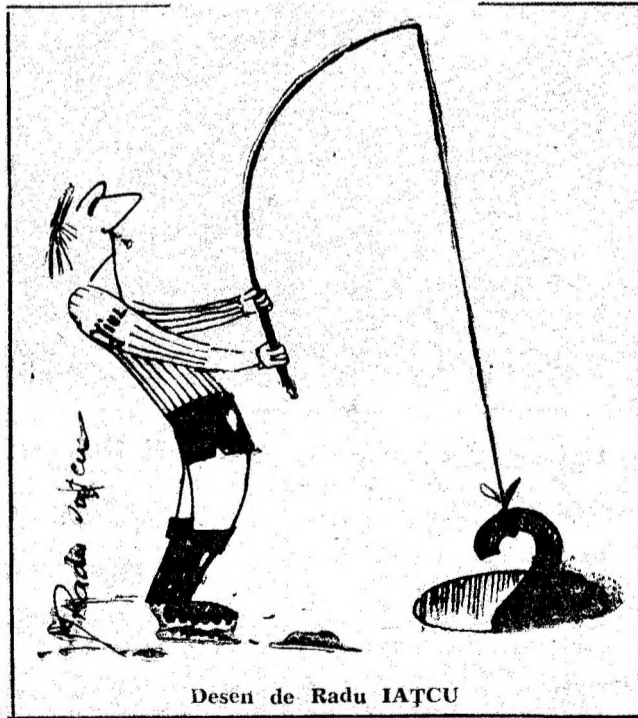
Desen de Radu IAȚCU