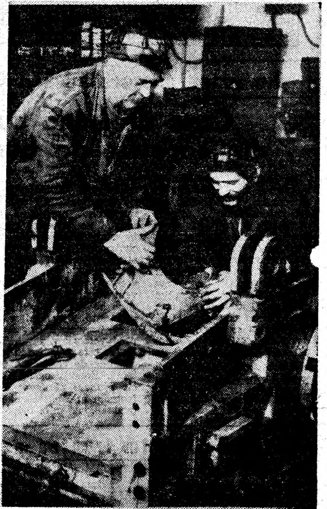
Aspect de muncă din cadrul atelierului de reparații complexe mecanizate de la mina Paroșeni.