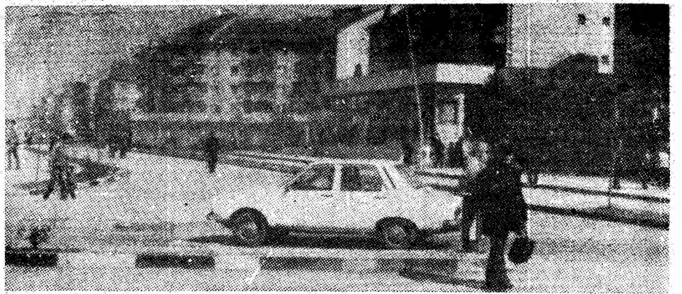
Primăvară pe bulevardul reședinței municipiului.