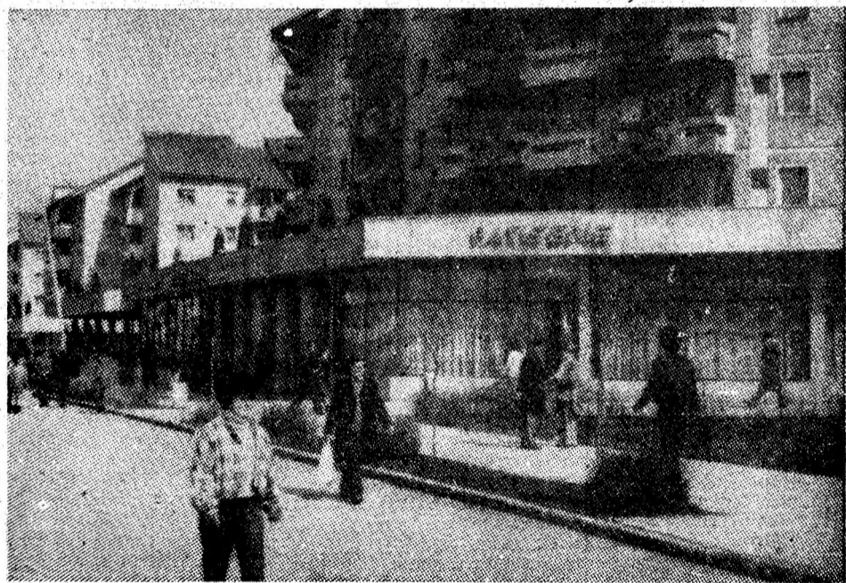
Primăvara '87 pe modernele artere ale Petroșaniului.

Succesele repurtate de colectivele celor două întreprinderi miniere au la bază atenția acordată creșterii productivității muncii, buna organizare a procesului de producție și utilizarea la capacitate a utilajelor din dotare. (Gh. O.)