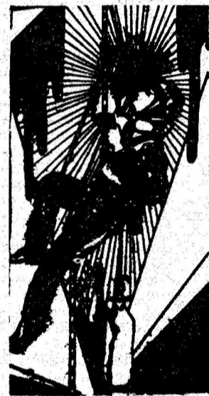
— pentru perioada următoare a anului competițional speo-sport ?

— Așadar, se anunță un debut promițător al activității speologilor. Ce perspective deschide el