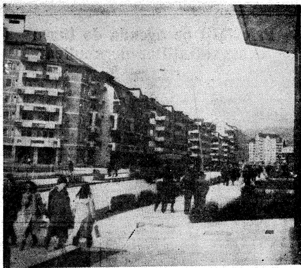
Zestrea edilitară a reședinței de municipiu a cunoscut în ultimii ani înnoiri substanțiale. În imagine: aspect de pe frumosul bulevard din cartierul Petroșani-Nord.

noștri, a echipamentelor complexului, ceea ce a provocat rămăneri în urmă față de plan, prin restanțele pe care le-am înregistrat în punerea în funcțiune la timp a abatajului de mare capacitate din panoul 3, stratul 17-18, blocul zero. Nu e mai puțin adevărat că și noi, prin nerespectarea