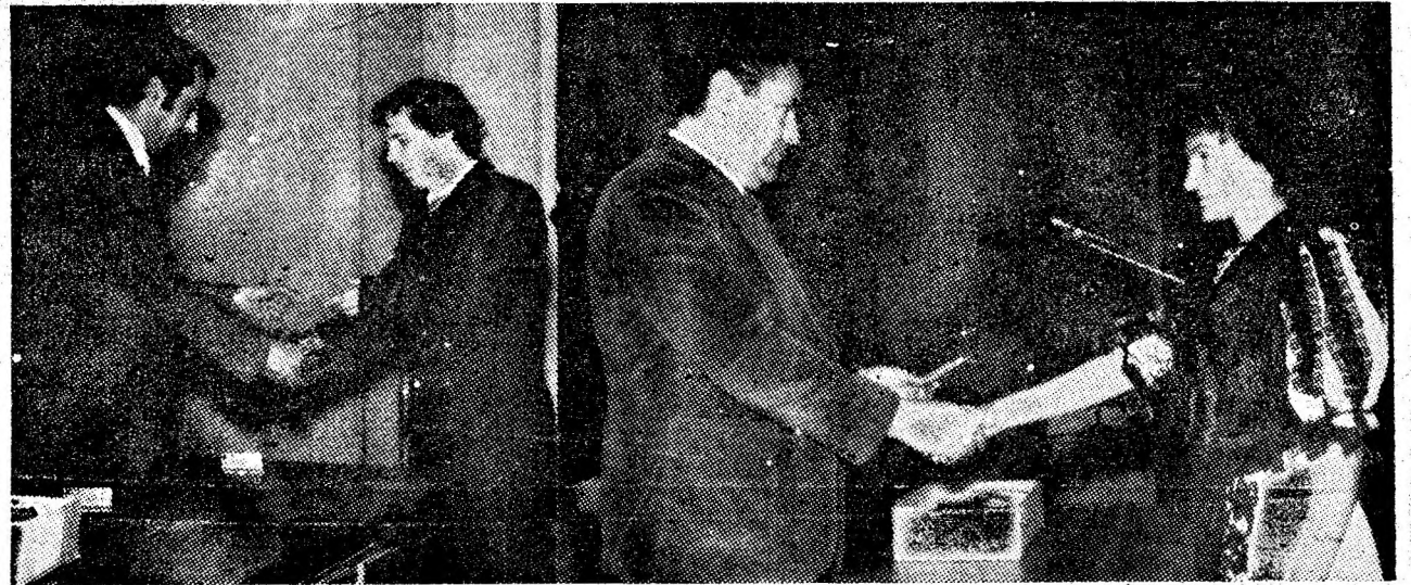
Momente încărcate de emoție, de adinci semnificații, prilejuite de primirea carnetului de membru al P.C.R.

În încheierea festivității, participanții au urmărit un reușit spectacol prezentat de formația artistică a Școlii generale nr. 4 Petroșani și corul „Armonii tinere” de la IUMP.