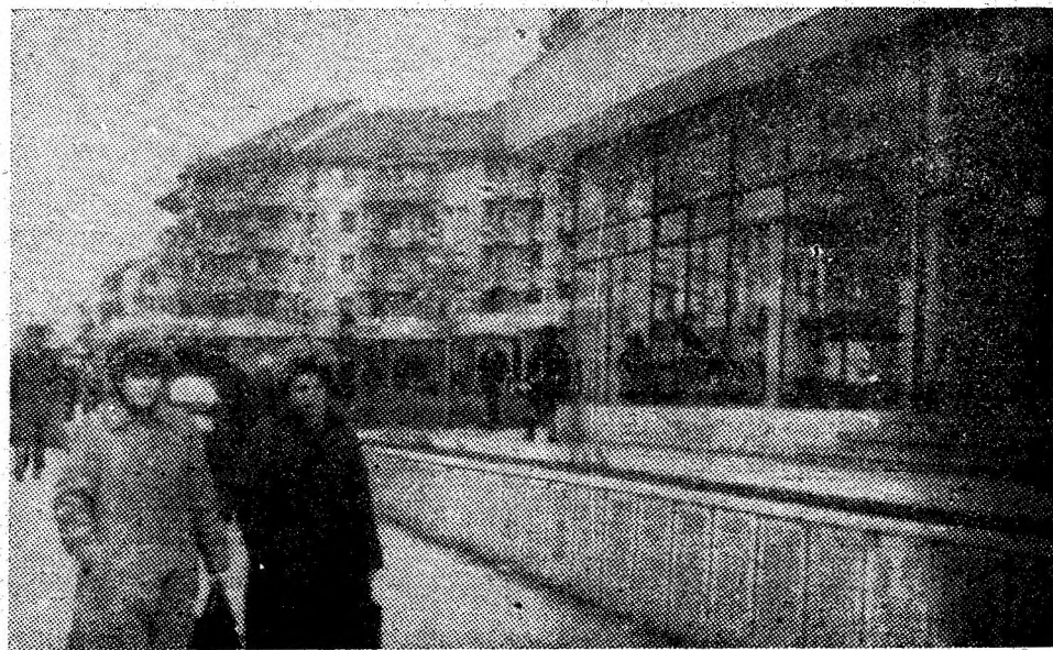
Inceput de primăvară în reședința municipiului.

Rezultatele obținute anul trecut atestă mobilitatea exemplară a colectivelor de muncă subordonate consiliului popular (EGCL, Brigada 50 a ACM Petroșani), precum și a tuturor deputaților și cetățenilor din cele 23 circumscripții electorale din teritoriul și îndreptătesc participarea la clasificarea la nivel național a orașului Uricani, care va reprezenta cu cinste Valea Jiului în întrecerea socialistă între localitățile țării.