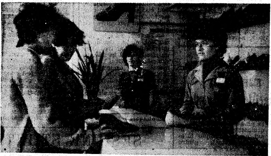
Amabilitate, servire promptă, civilizată la magazinul nr. 45 „Încălțăminte” al ICS Mixtă Vulcan.