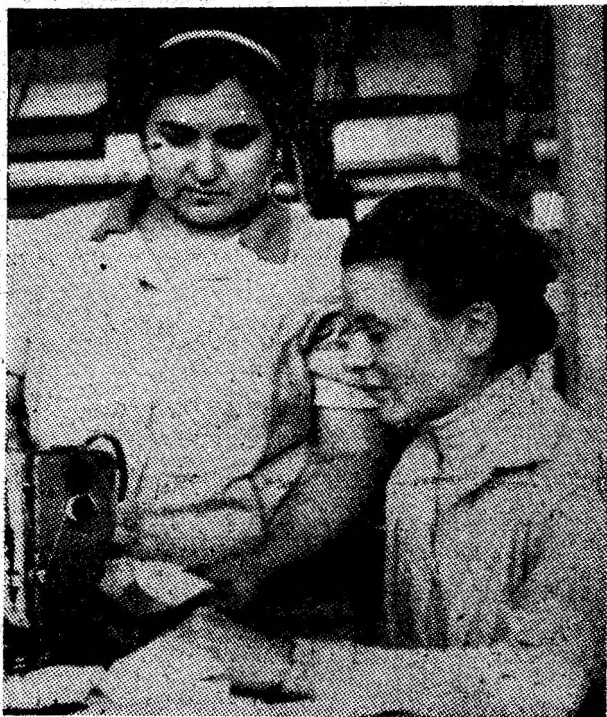
Hărnicie în atelierul întreprinderii de confecții din Vulcan.

Cursurile pentru anii I și III se desfășoară în ziua de luni, 11 mai a.c., la Cabinetul municipal de partid.