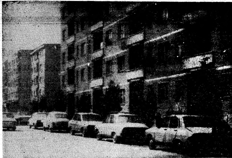
Imagine din Uricani '87.