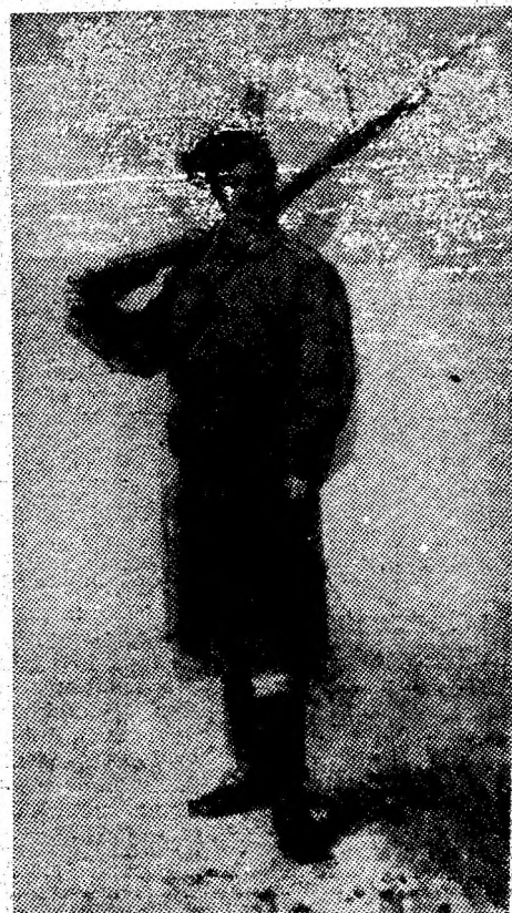
„Dorobanțul”. pictură de N. Gri-gorescu.