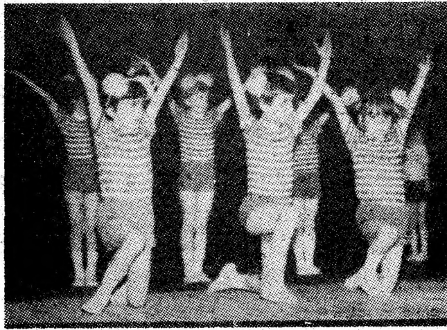
O evoluție plină de grație, gingășie și candoare — iată ce a caracterizat prestația de gimnastică a preșcolarilor.