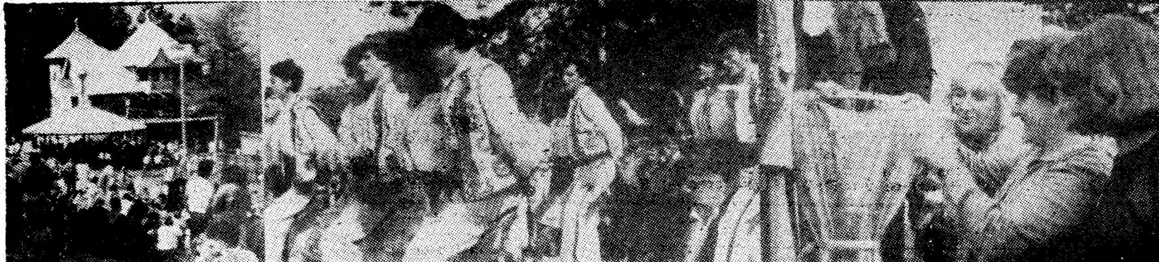
Afluență mare la locul de agrement „La Brazi”. Evoluează formația de dansuri a ansamblului folcloric al Casei de cultură din Rovinari. Un alt moment al Nedeei: tîrgul cooperăției meșteșugărești, ediția a IV-a.