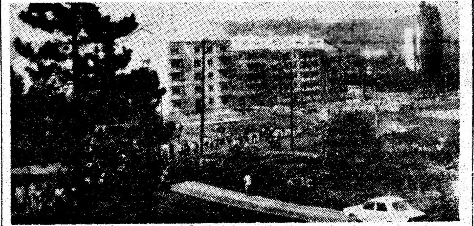
Duminică, toate drumurile din Vulcan au dus „La Brazi”.