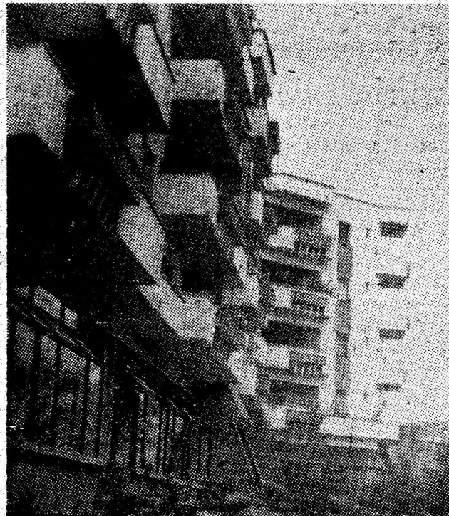
Imagini citadine din orașul minerilor, Uricani.

Din numărul total al personalului muncitor din întreprindere, peste 800 sînt femei. Există o importantă resursă de sporire a acestei categorii de personal, dacă se ține cont de condițiile de muncă, de structura meseriilor deficitare din noua instalație. Iar în acest domeniu, în orașul Lupeni și în alte localități din municipiu există disponibilități reale, îndeosebi în rîndul absolventelor de liceu. Conducerea întreprinderii asigură repartizarea de locuințe, în limitele disponibilităților și a ritmului ridicat de construcții de locuințe din Lupeni. În noua instalație, condițiile de lucru sînt incomparabil mai bune, decît în vechea instalație „Viscoza”. Ceea ce se cere însă este mai multă preocupare pentru sporirea forței de muncă în ritm accelerat, la nivelul cerințelor impuse de sarcinile producției fizice.