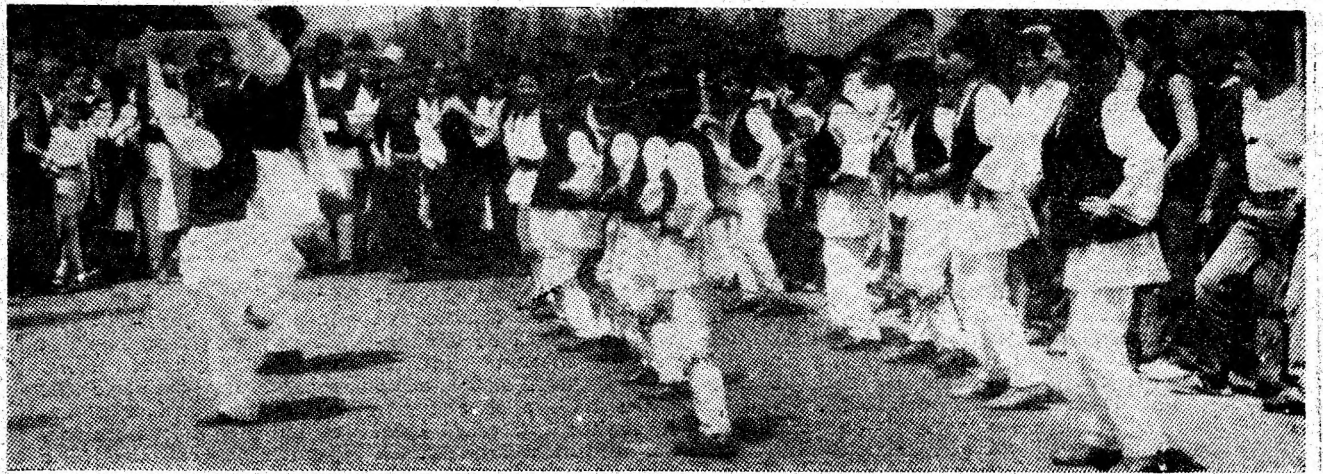
Aspect de la încheierea „Nedeii Tulipanului”.

Acolo unde au existat preocupări atente ale organizatorilor de a desfășura acțiuni bine pregătite, de calitate, manifestările au fost, într-adevăr reușite, publicul larg participînd cu mult interes. Dar au fost și situații în care pregătirea superficială a manifestării a făcut, fie ca aceasta să se dilueze în conținut, fie ca publicul să participe în număr mic, fie ca faptul de cultură propriu-zis să piardă în calitate. Fără