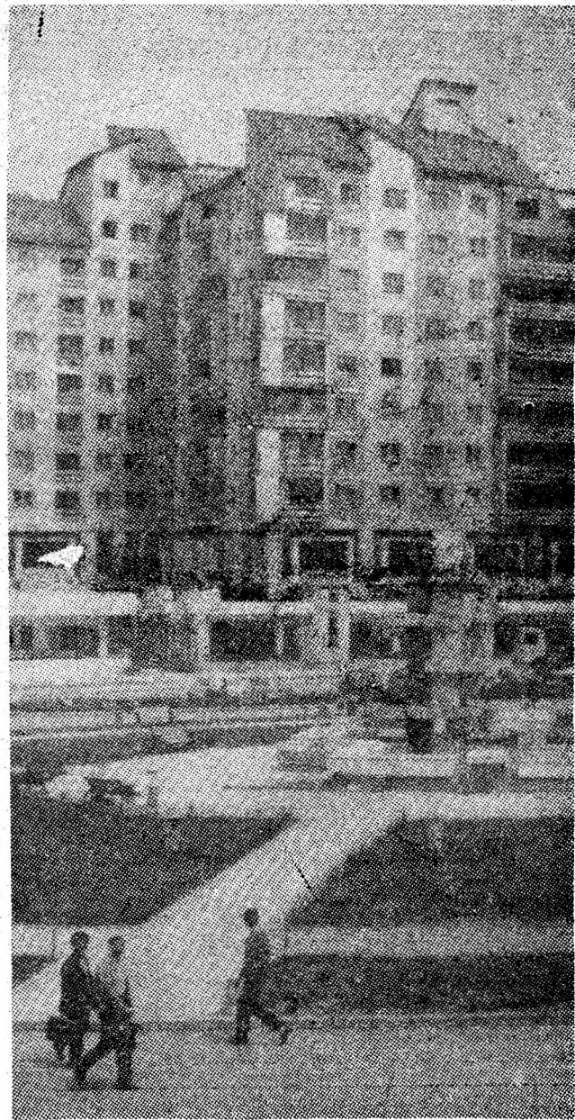
Petroșani-Nord: elemente de arhitectură modernă.

La obținerea acestor rezultate care ridică pe noi trepte calitative hărnicia confecționarilor din Vulcan a participat, cu hotărîre, tot colectivul întreprinderii. (G. D.)