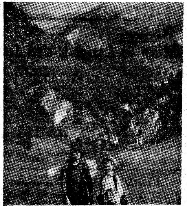
Drumeție la Cimpul Mielului, Retezatul Mic.