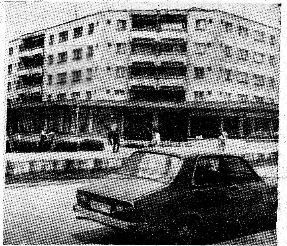
Lupeni — un oraș al inovațiilor continue.