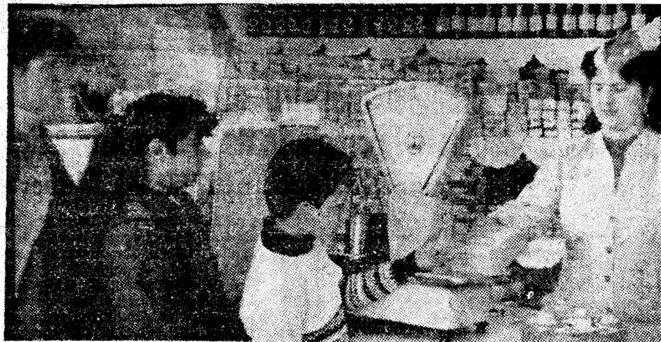
Cofetăria din cartierul Bucura, parterul blocului nr. 2, asigură o diversitate de mărfuri și o servire de calitate pentru locuitorii Uricaniului.