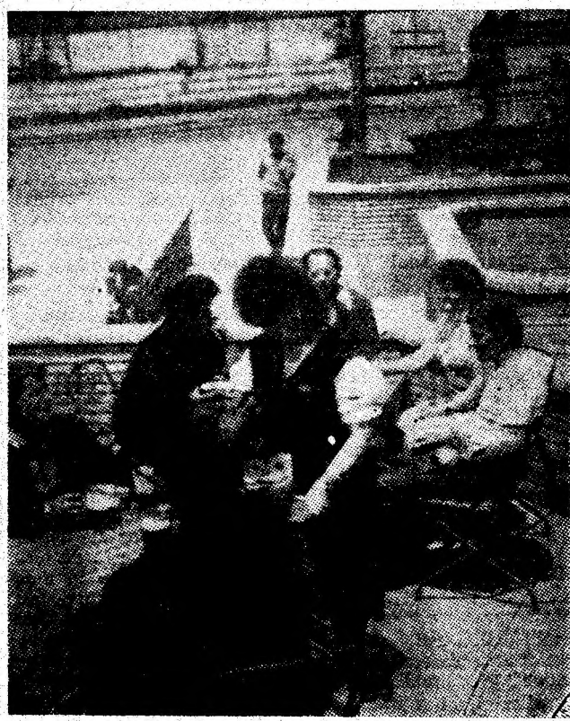
Deosebit de solicitate, în aceste zile călduroase, sînt terasele de vară ale restaurantelor. Imagine de pe terasa braseriei din cadrul Complexului de alimentație publică din Lupeni.

Țin oare, neapărat, gospodarii stației C.F.R. Petroșani să aibă în „inventar” un atare tobogan? Așteptăm un răspuns pentru a-l da, la rîndul nostru, cititorilor care s-au adresat ziarului cu sesizări despre scara buclușasă. (I. B.)