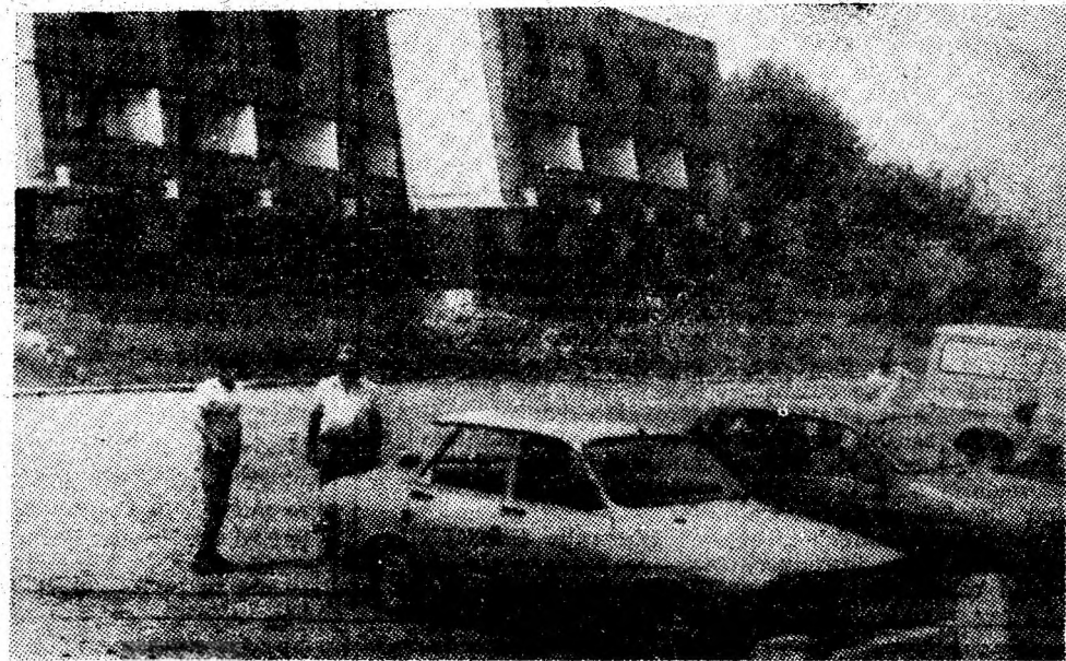
O gazdă primitoare pentru cei care vizitează municipiul nostru: Motelul „Gambinus“.

Ziua brigadierilor a exprimat voința fermă a formațiilor de lucru, a cadrelor tehnico-ingenerești de a materializa potențialul de muncă și creație al colectivului în realizări superioare.