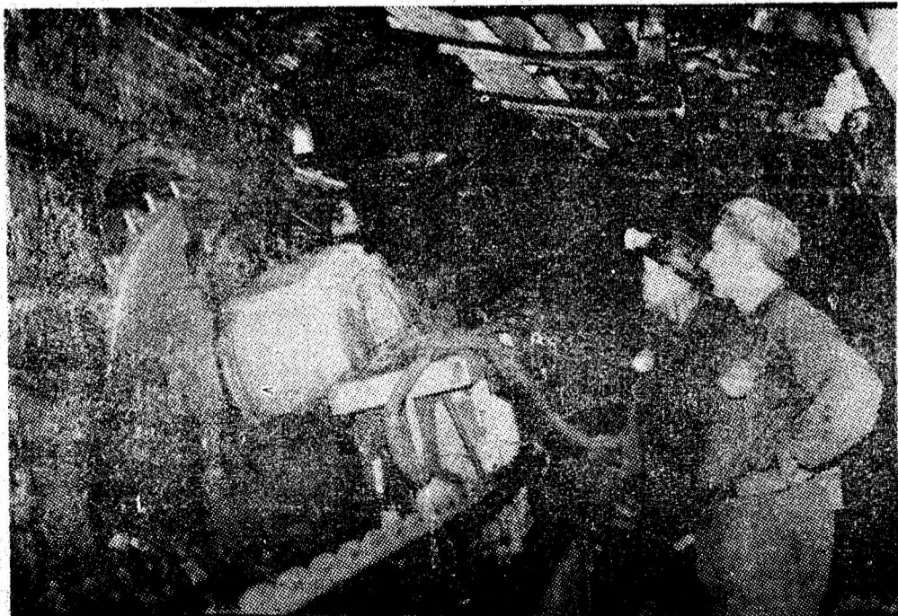
Mecanizarea extracției cărbunelui — domeniu prioritar în activitatea din subteran.