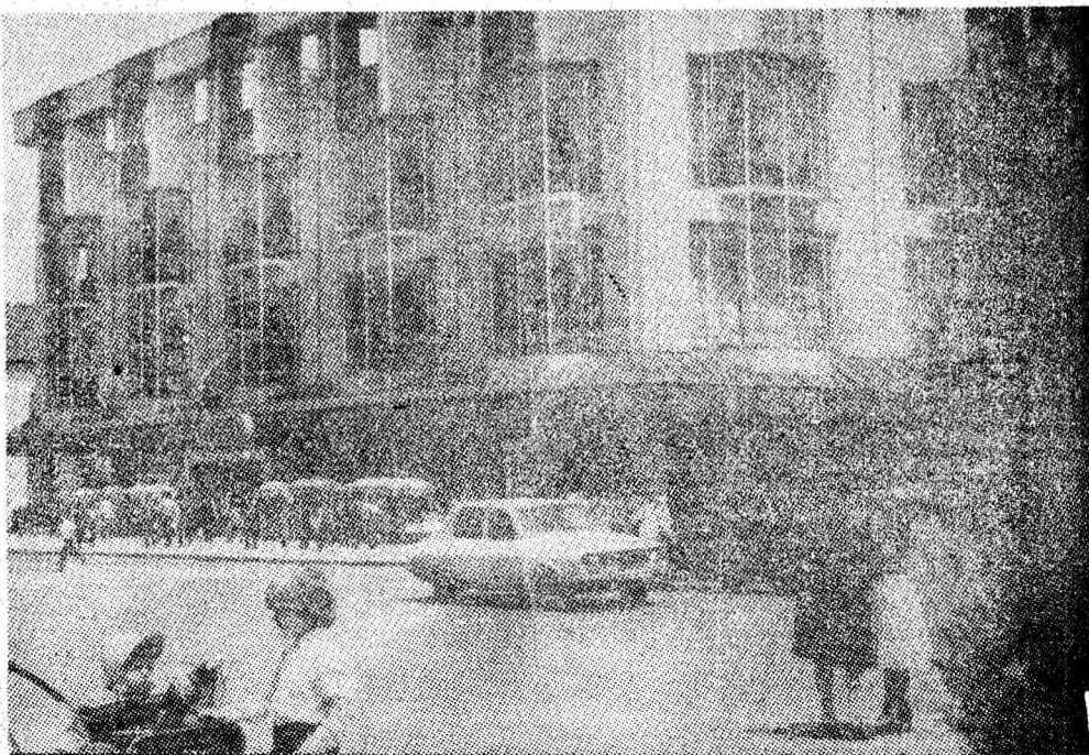
Modernul magazin universal „Jiul”, loc de continuă atracție pentru populație.