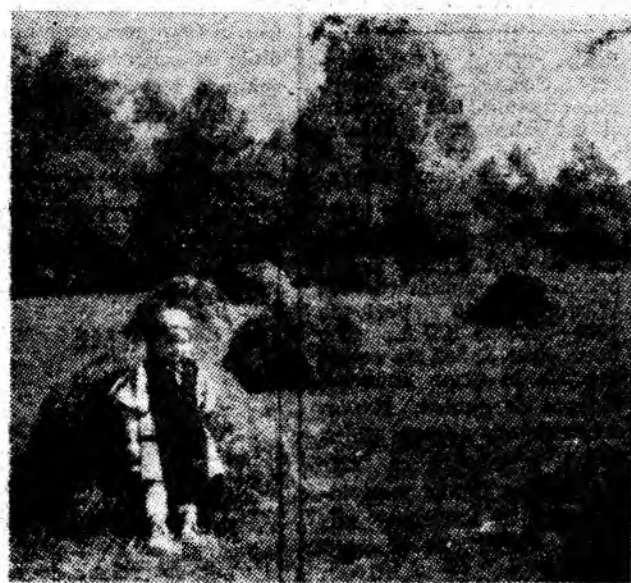
În miez de vară.