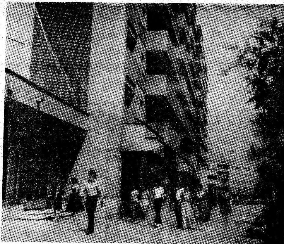
Siluele îndrăznețe ale noii arhitectonici, în orașul Vulcan.