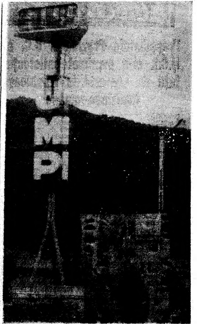
Ora exactă.