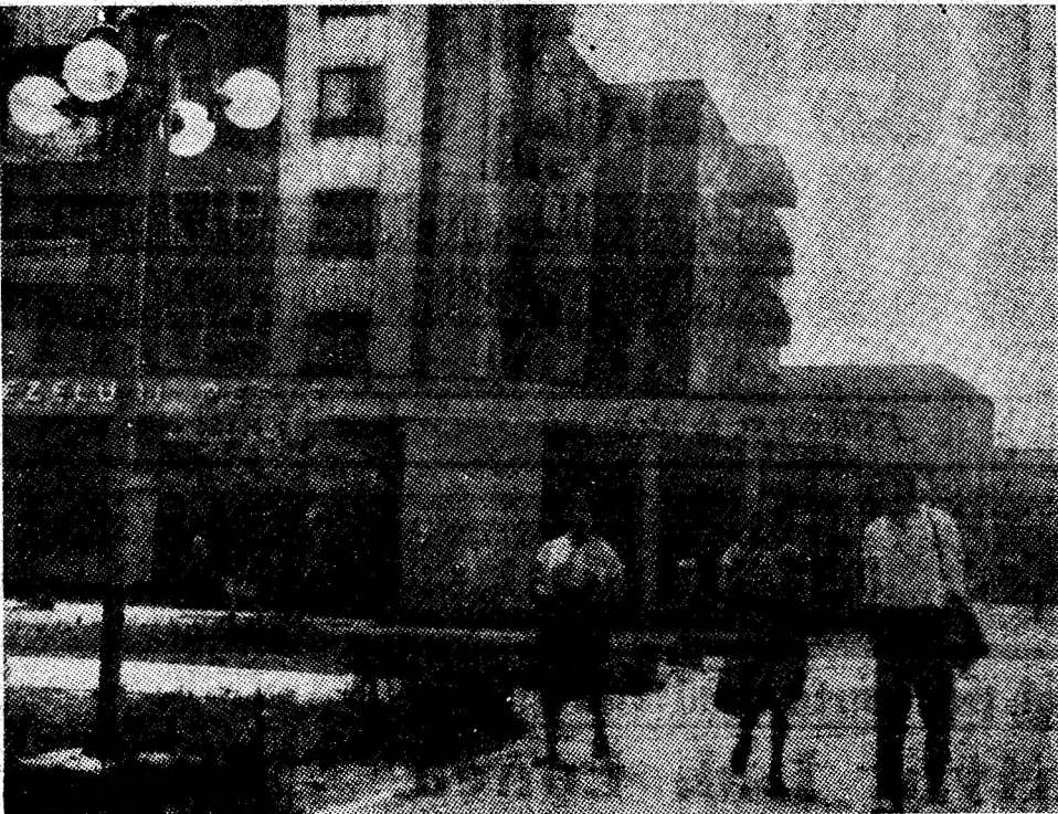
La pas cu tinereșea, prin Petrila.