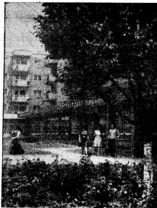
Crimpei arhitectonic din Petrița.