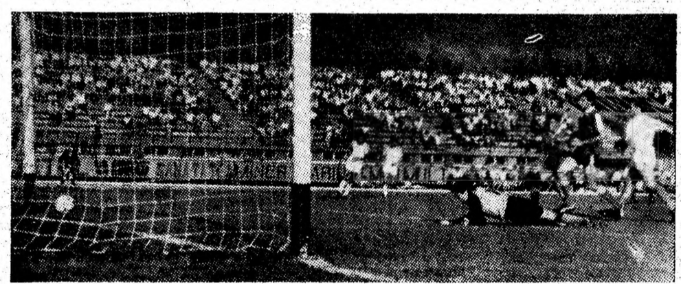
Șutul lui Geolgău este necruțător și Jiul — „U” Craiova 0-3 în finala turneului dotat cu „Cupa Minerul”.