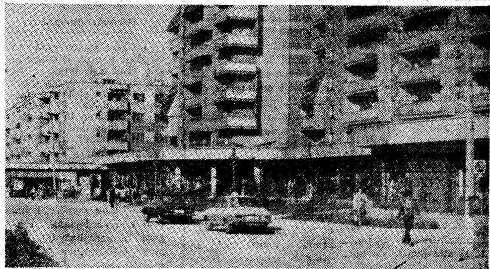
Vedere de ansamblu a bulevardului Păcii din Lupeni, remarcabilă înfăptuire urbanistică a orașului din acești ani.