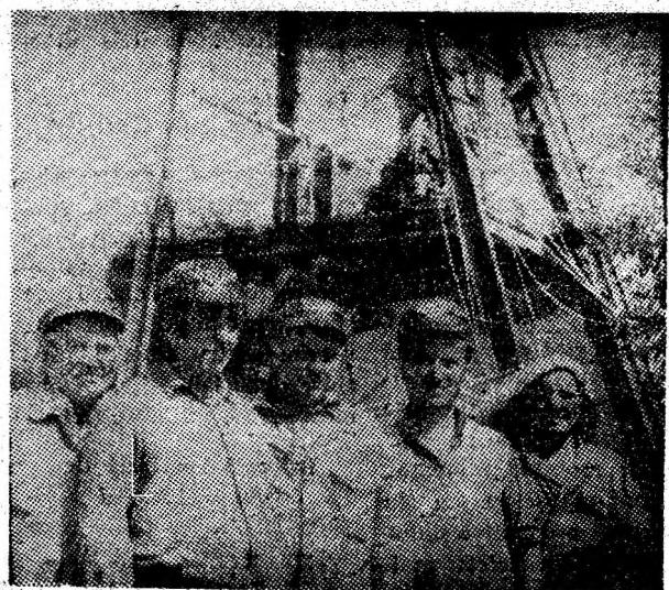
Mineri și electrolăcăuși, oameni care au dat startul lucrărilor de deschidere a minei Iseroni.