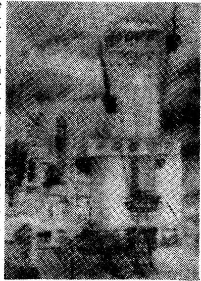
„Fuțul Sud-Aninoasa”, una din lucrările reprezentative ale pictoriței.