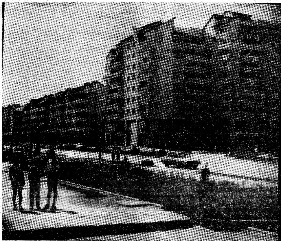
Secvență de pe magistrala modernului cartier Petrosani-Nord.