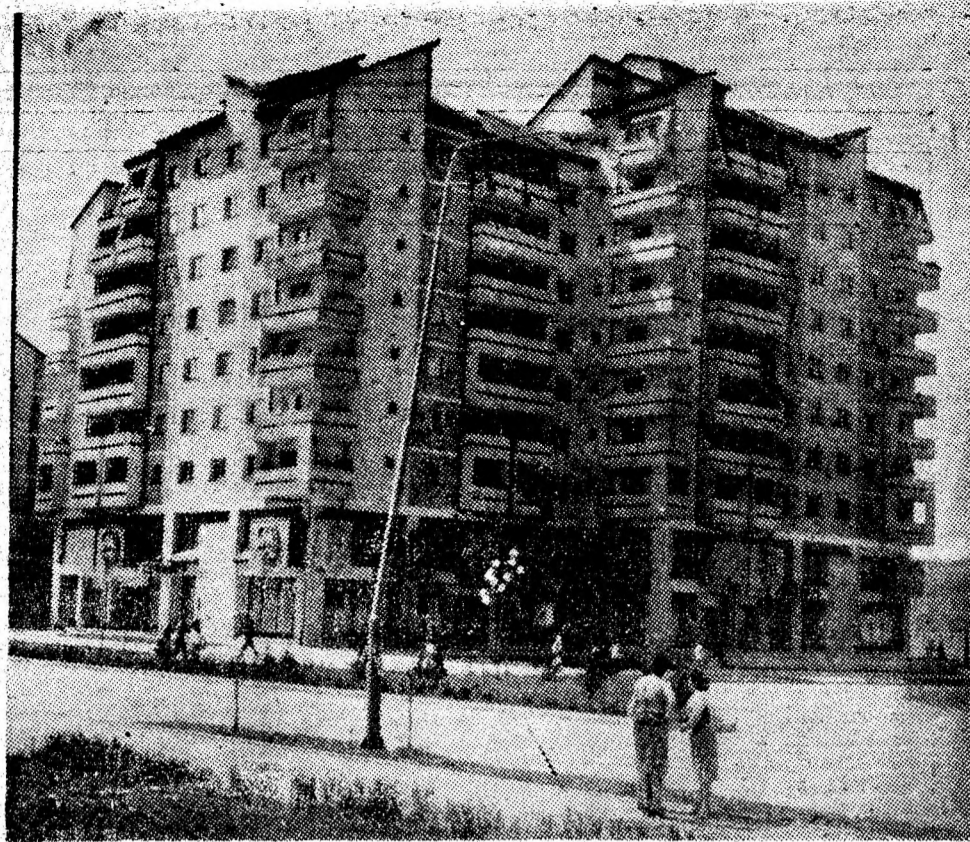
Secvență din cartierul Petrosani Nord.