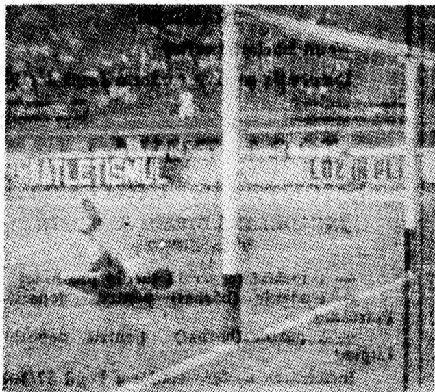
Moromete înscrie primul său gol, în partida cu Chimia, „semnind” desprinderea Jiului de partenera sa de întrecere.