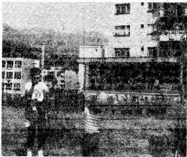
Crimpet din mereu înăurul oraș Lupeni.