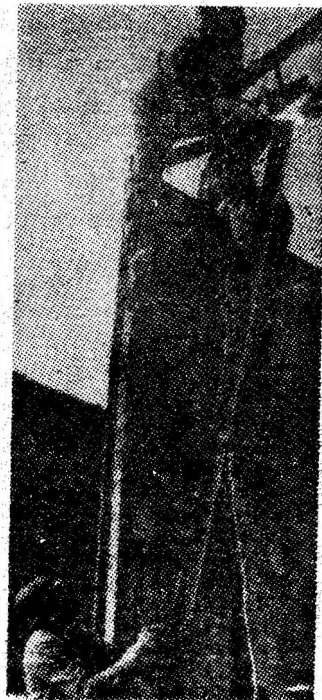
I.M. Cîmpu lui Neag. Se lucrează la extinderea spațiilor de depozitare.

Atmosfera de sărbătoare a muncii a fost întreținută cu vervă de formația de muzică ușoară „Melodie” și de grupul de interpreți de muzică fină, care activează în cadrul clubului. (Al. H.)