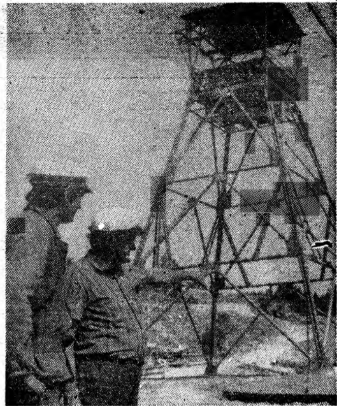
I.M. Cîmpu lui Neag. Se urmărește execuția lucrărilor la puțul auxiliar.

ANUL XLIII, NR. 10 892 | MIERCURI, 23 SEPTEMBRIE 1987 | 4 PAG. — 50 BANI