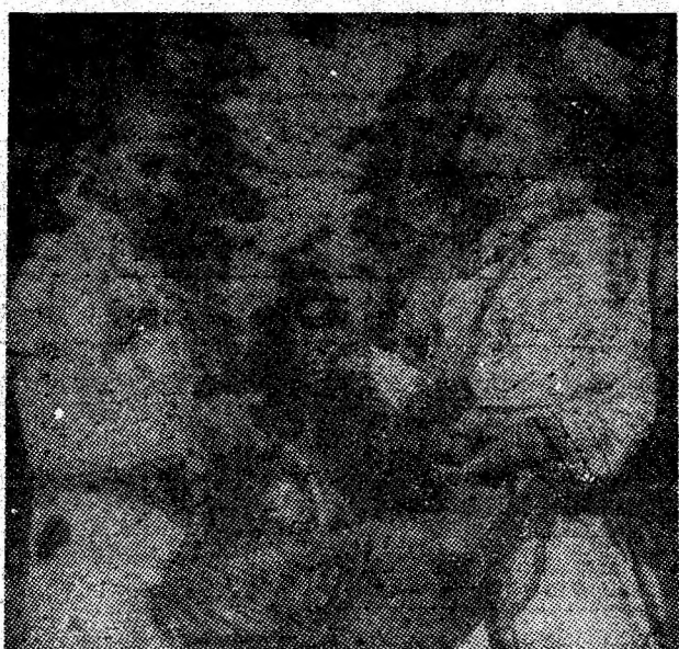
Pledoarie pentru fantezie și bun gust.

Am urmărit cu atenție concursurile purtând denumiri sugestive: „Trec detașamentele cântând”, „Sanitarii pricepuți”, ștafeta sportivă, concursurile de orientare turistică, și de interpretare muzicală, competițiile celor mai originale costume, sau ale celor mai buni bucătari. Inventivitate, inițiativă, îndemnare, inteligență — iată coordonatele manifestării de du-