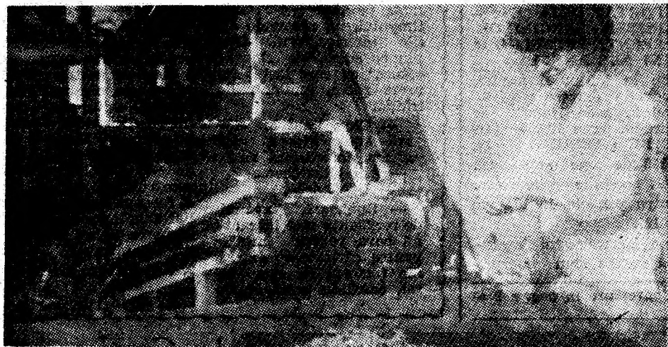
Aspect din secția de producere a sortimentului „Pufuleți”, a Fabricii de morărit și panificație Petroșani.