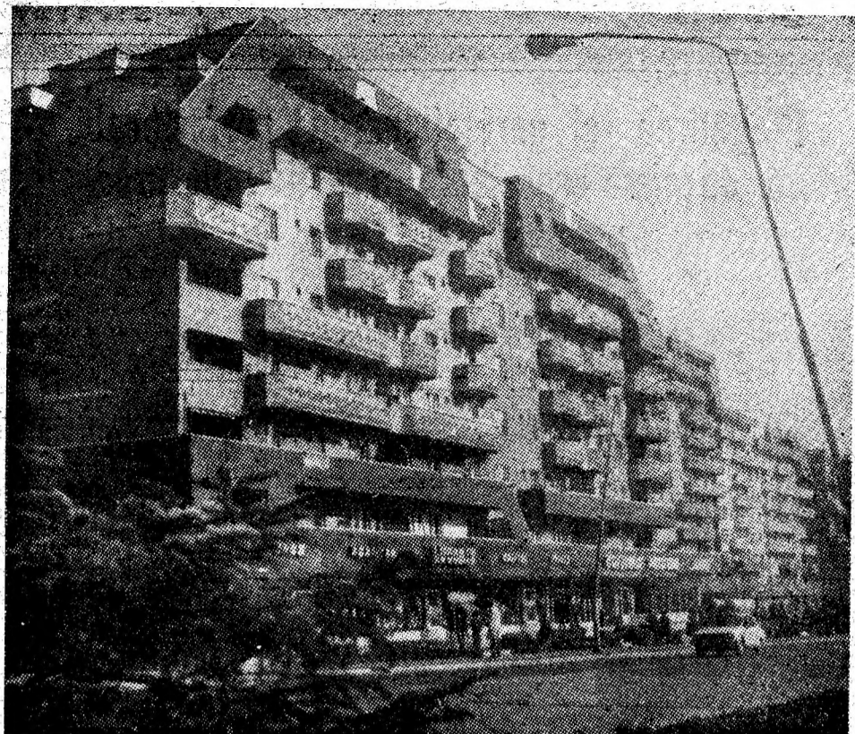
Petroșani, într-o zi frumoasă de octombrie.