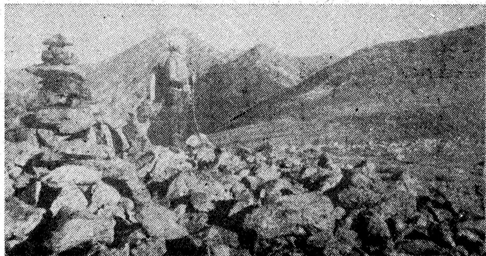
Toamnă în Retezat.