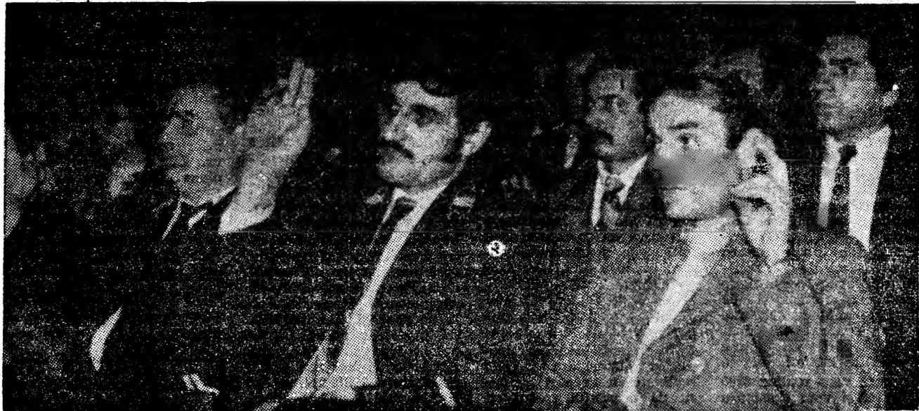
Aspect din adunarea reprezentanților oamenilor muncii din cadrul unităților CMVJ.

Programul cu care Frontul Democrației și Unității Socialiste se prezintă în fața alegătorilor, platforma politică a candidaților săi, au drept scop îndeplinirea mărețelor obiective ale Programului Partidului Comunist Român de edificare a societății socialiste multilateral dezvoltate și înaintare a patriei spre comunism, îndeplinirea hotărîrilor Congresului al XIII-lea, materializate în sarcinile actualului plan cincinal, care asigură mersul neabătut al României pe calea dezvoltării și modernizării forței sale economice, creșterea avuției naționale și a bunăstării întregului popor, trecerea României socialiste în rîndul țărilor cu nivel mediu de dezvoltare.