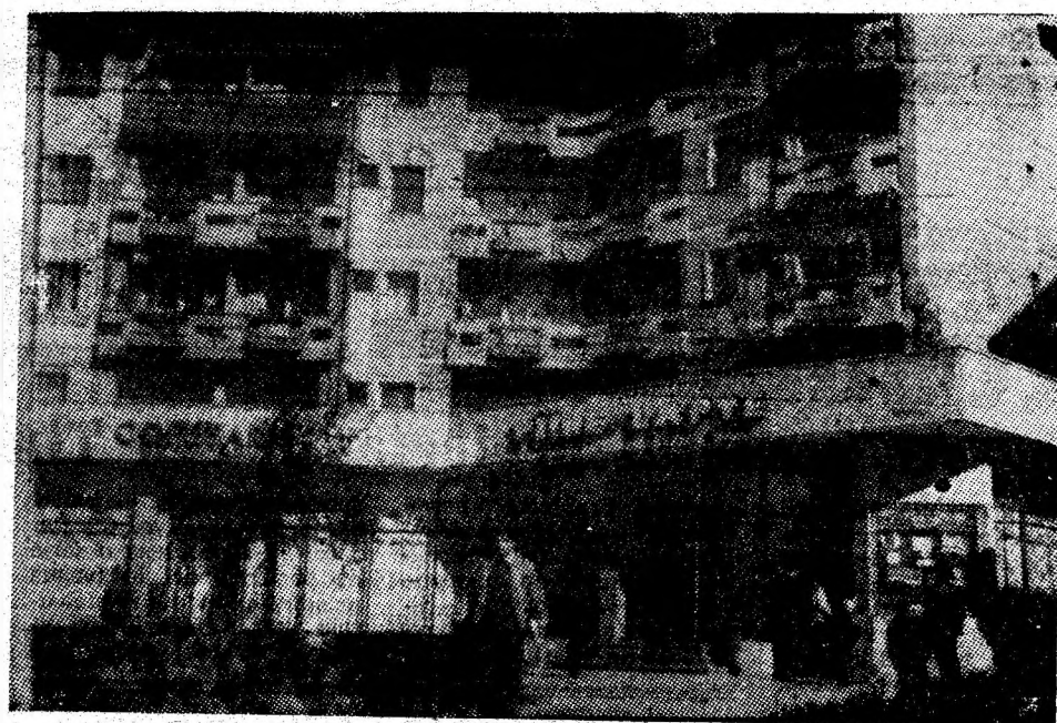
Bogată paletă de elemente arhitecturale moderne în Petroșani-Nord.