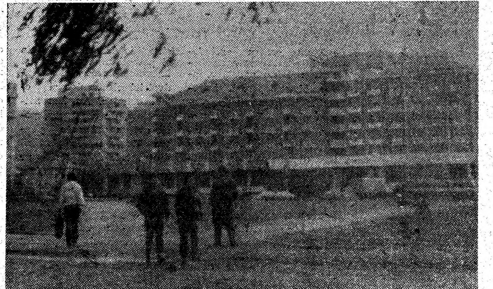
Un edificiu dat în folosință în reședința de municipiu în această legislatură — Hotelul Petroșani.