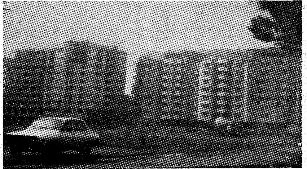
În zona vechiului stadion, s-au înălțat blocuri confortabile care îmbină, armonios, elementul arhitectonic modern cu cel local.

Orașul este o emblemă a hărniciei oamenilor. Așa cum sînt oamenii, inventivi, cu constantă inițiativă pentru realizarea unor noi fapte de vrednicie în muncă și în atmosfera cetădenă, așa este orașul nostru aflat pe traiectoria impetuoasă a dezvoltării economice și sociale.