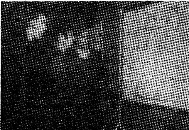
La Casa de cultură, cetățenii consultă listele de alegători.

• În parcul amenajat, în acest an — cu rodnică muncă a tineretului școlar, între Casa de cultură și Hotelul Petroșani — cu o suprafață de 3000 mp, s-au plantat 2000 flori de talie mică.