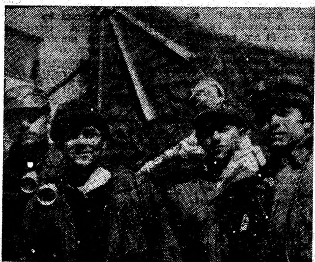
Minerii de la Vulcan, asemenea tuturor oamenilor muncii din abatajele Văii Jiului, acționează stăruitor pentru creșterea producției de cărbune și economisirea energiei.

Citiți în pagina 3-a reportaje, note și însemnări din realizările înfăptuite în reședința municipiului.