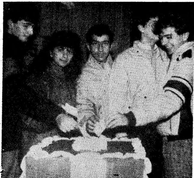
Primul vot. Un moment de neuitat pentru acești tineri, elevi ai Liceului industrial din Vulcan.