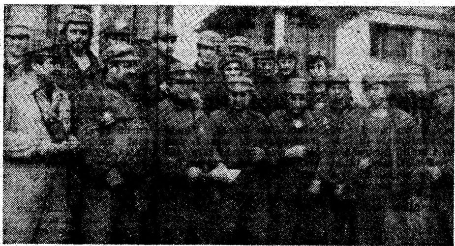
Mineri din harnicul colectiv al Întreprinderii miniere Paroșeni.