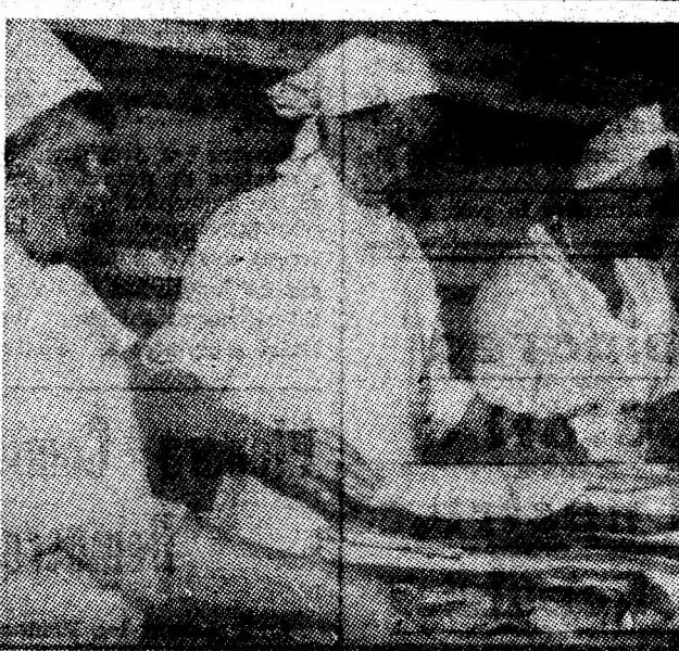
Aspect din noul și modernul laborator de cofetărie-patiserie din Vulcan.