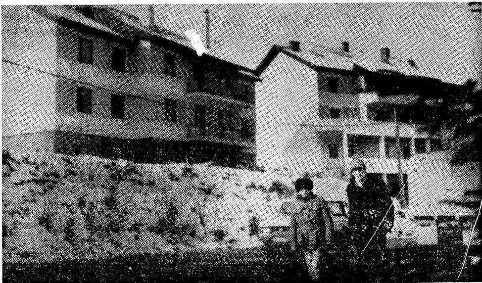
Contururi urbanistice dobîndite de comuna Bănița.

Gazda noastră ne vorbește de ceilalți gospodari din sat Marcu Șotîngă, care a încheiat contracte cu statul pentru 2 oi, 2 miei, porc, lînă, 60 kg caș, 1600 l de lapte, sau Gavrilă Popescu, alt bun gospodar. „In fiecare an, din cele patru decenii ale Republicii, am văzut cum viața devine tot mai bogată, cum casele se înalță parcă mai falnice, iar lumina își face drum mai întîi în case, apoi printre oameni“.