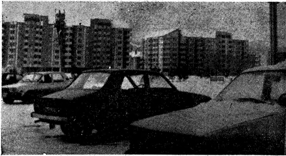
Petroșaniul sub semnul confortului urban.