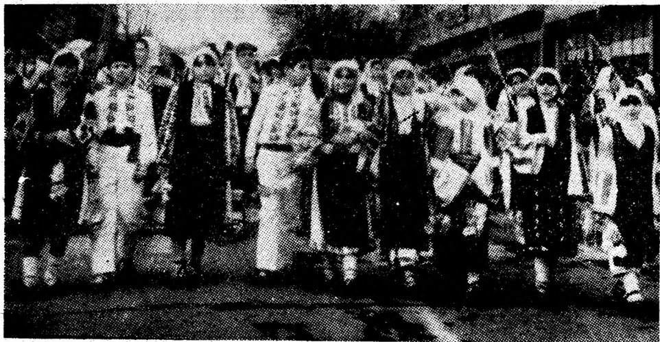
Pledoarie pentru frumusețea folclorului.