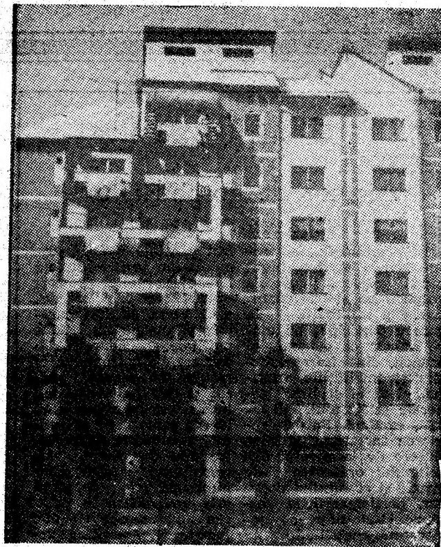
Verticale în reședința de municipiu.