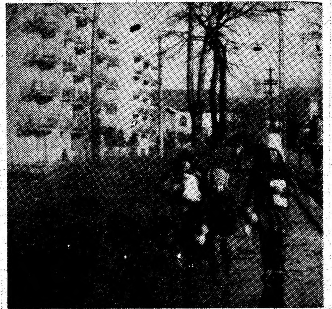
Secvență din Lonea.